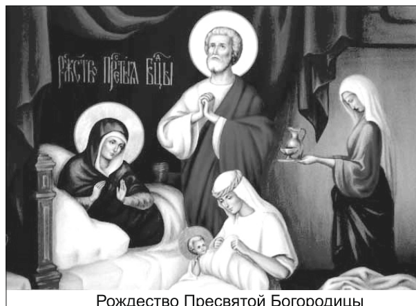
Рождество Пресвятой Богородицы

Когда мы говорим «старый стиль», то имеется в виду юлианский календарь. Этот календарь был разработан группой александрийских астрономов и введен в употребление Юлием Цезарем с 1 января 45 года до Р.Х.. Именно этот календарь лег в осно-