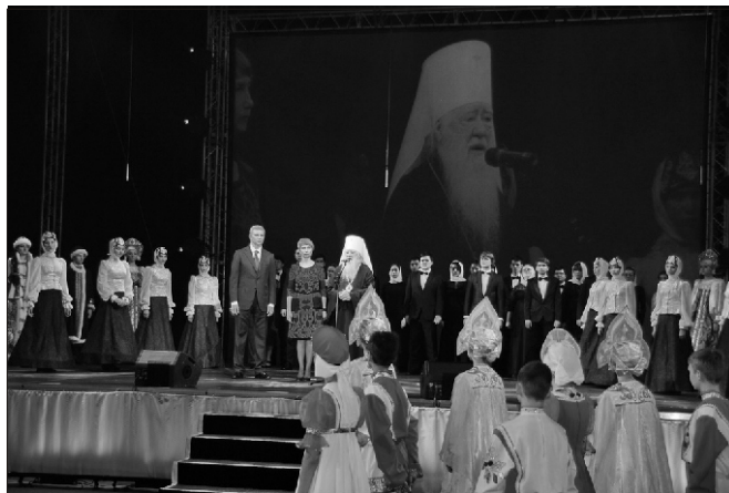
Закрытие Рождественских чтений

10 декабря в городе Одинцово состоялось закрытие об-