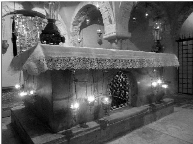
Гробница Святителя Николая