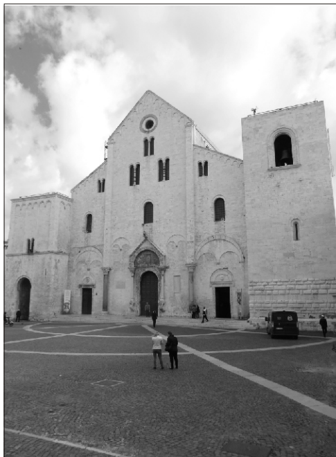
Базилика Св. Николая

менные дома. Окна закрыты ставнями от жаркого солнца. Белье сохнет на веревках, растянутых между домами. На ступенях, подоконниках, бочках дремлют разноцветные коты и кошки. Женщины в белых фартуках делают макароны вручную на деревянных столиках возле порогов своих домов. Мужчины пьют кофе и читают газеты в маленьких уютных кофейнях. Торговцы рыбой, зеленью и фруктами весело зазывают покупателей. Соседи громко переговариваются друг с другом с балконов своих домов. Родители развозят детей на стареньких велосипедах по детским садам и школам, на машине по узким средневековым улочкам не проехать. А над всем этим огромное, ярко голубое итальянское небо. Обычный южный город, который стал известен на весь мир.