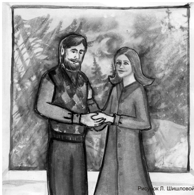
Рисунок Л. Шишловой

Вы храм Божий, и Дух Божий живет в вас (1 Кор. 3, 16) Сздание Никольского храма с. Николо-Крутины Егорьевского района