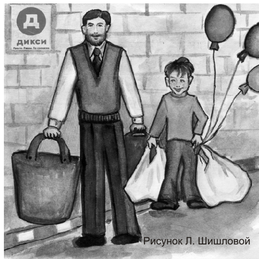
Рисунок Л. Шишловой

Продуктов набрали Наверное, тонну! И по пути говорим Оживлённо, И сумки несём мы Легко, не натужно, Недаром мы с папой С гантелями дружим. А мама тащила бы их Еле-еле Она по утрам Не подходит к гантелям. Зачем ей Железные эти друзья, Когда есть у мамы И папа, и я!