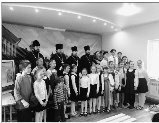
В церковном доме Никольского храма 17 февраля