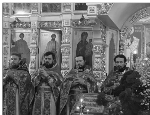
В Никольском храме на богослужении 17 февраля

Христианство на Руси было принято около 1000 лет назад в 988 году и до того ужасного дня начала революции все жители России были рады тому, что там, наверху, есть Всемогущий Бог, который защитит нас!