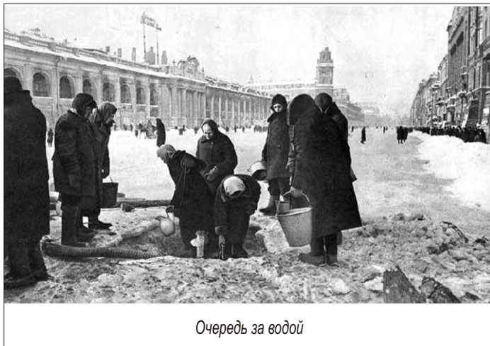
Очередь за водой

Бабуля потом очень дорожила этими книжками. Оборачивала в папиросную бумагу, когда давала нам с сестрой их почитать и следила, чтобы мы не ели и не пачкали, чтобы только чистыми руками. Еще Пушкин – почему-то остался последний том дореволюционного собрания сочинений, без обложки. С выданными в начале листами.