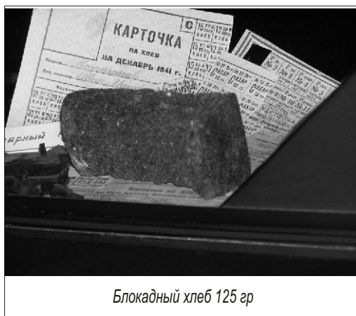
Блокадный хлеб 125 гр

Мужчины вообще тяжелее переносили голод, особенно старые. А других и не было. Дедушка (мой прадедусшка) тоже все время по ночам (а иногда и днем) плакал от голода, строго следил, чтобы мама с ним сковородку лизали по очереди (а на ней ведь и так ничего не оставалось)... Бабуля иногда тайком от него кинет маме в кровать кусочек сахара, а заговорщицки улыбнуться у нее уже и сил нет, только посмотрит, чтобы