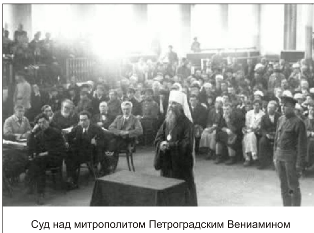
Суд над митрополитом Петроградским Вениамином

Только вздох пронесся по залу при объявлении приговора. Ни стоны... ни плача. Приносилась великая искупительная жертва за грехи Русского народа, и безмолвно разошелся народ. Но не домой, а на площадь, где всю ночь ожидали рокового часа многие и многие... Было уже светло, солнце всходило, когда раскрылись тяжелые двери суда и приговоренные "смертники", окруженные лесом шты-