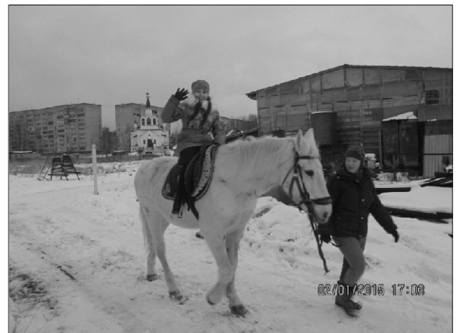
Верхом на Орловском рысаке