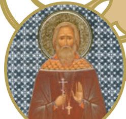
СЩМЧ. НИКОЛАЙ ГОРЬЕВСКИЙ

ИЗДАНИЕ НИКОЛЬСКОГО ХРАМА С. НИКОЛО-КРУТИНЫ ГОРЬЕВСКОГО РАЙОНА