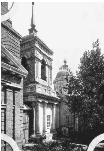
Никольский храм. Ростов на Дону. XIX в.