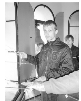
Первые уроки звонарского искусства