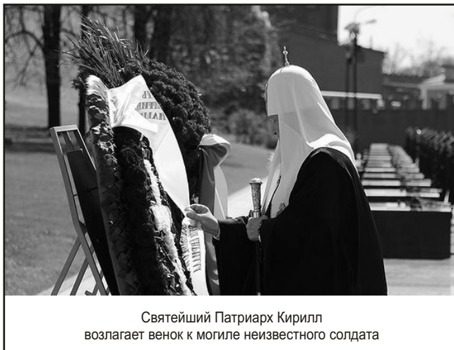
Святейший Патриарх Кирилл возлагает венок к могиле неизвестного солдата

Если что-то непонятно, пишите, постараюсь помочь разобраться.