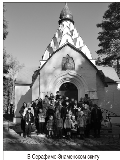
В Серафимо-Знаменском скиту

И вот немного уставшая, но счастливая «Лествица» приближается к родному городу. Поздний луч заходящего солнца играет на куполах то и дело выплывающих белых лебедей – храмов. Святая Русь! ... Да, Святая... Только верой держится Россия, крепнет и цветет, становясь все краше и краше. Как хорошо!