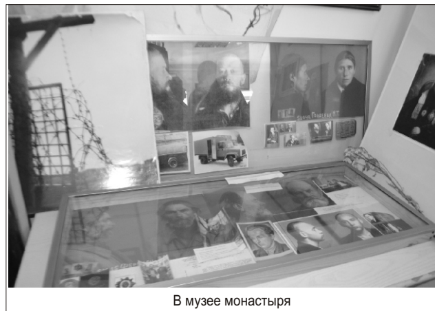
В музее монастыря

матушки не была безоблачной: сиротство, путь к мона-