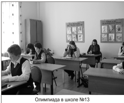
Олимпиада в школе №13

Победители школьных олимпиад примут участие в муниципальной олимпиаде 26 апреля. Участники муниципального этапа должны будут выполнить домаш-