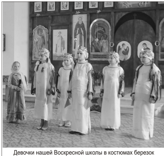
Девочки нашей Воскресной школы в костюмах березок

Березки спрашивают друг у друга: «В чем сила земли русской?» И отвечают: «Подвигами святых людей, живших в России». А затем рассказывают в стихотворной форме о жизни преподобного Сергия Радонежского.