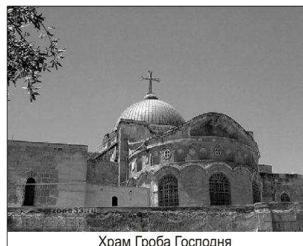
Храм Гроба Господня