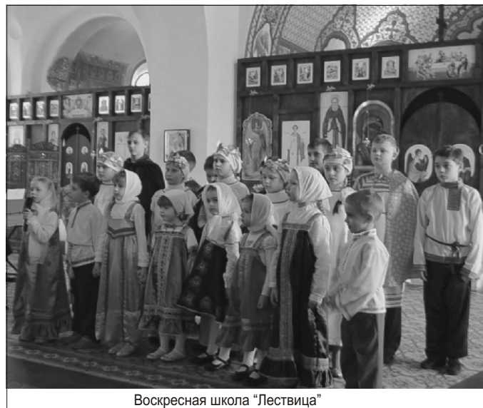
Воскресная школа «Лестница»

Первое место в этом конкурсе жюри присудило ребятам из нашей Воскресной школы. Сценка «Лестницы» была посвящена жизни преподобного Сергия Радонежского, ведь 700-летие со его дня рождения отмечает Русская Православная Церковь в этом году. Она начинается с лирического вступления девочек-