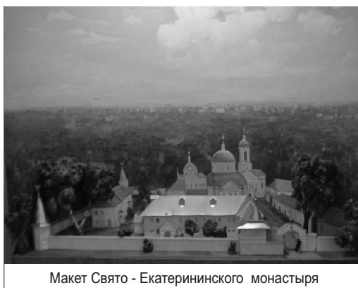
Макет Свято - Екатерининского монастыря

Позже монастырь стал школой милиции. Территорию обители пересекали полосы препятствий, храм превратился в спортзал, алтарь – в гараж... И только в 1992 году монахам отдали