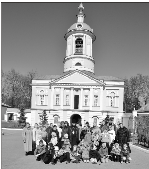
В Свято - Екатерининском монастыре

Жизнь монастыря была не из легких. Так, при Петре I братия обители была вынуждена – просить императора о помощи, чтоб не умереть с голоду. Но особенно горькой страницей обители является период безбожной советской власти. В разоренной, оскверненной обители была учреждена одна из самых страшных тюрем того времени – Сухановская, о которой нам поведали