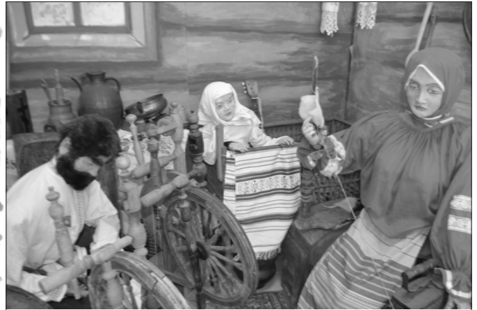
Восковые фигуры в музее Свято-Екатерининского монастыря

Я считаю, что каникулы я провела с пользой для души. Мы с Улей помогали обламывать на огороде сухую малину и жечь ее на костре, следили за маленьким братом, гуляли с ним, мыли посуду, чистили картошку. На каникулах мы ездили вместе с Воскресной школой в поездку в Свято-Екатерининский монастырь и Серафимо-Знаменский скит. Больше всего мне понравились восковые фигуры крестьян, они смотрели на нас, словно живые. Еще мне запомнился очень красивый крест святой Нины, я увидела его в Знаменском скиту. Святую привезли специально из Грузии.