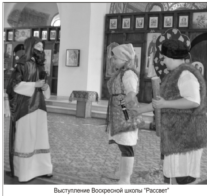
Выступление Воскресной школы «Рассвет»