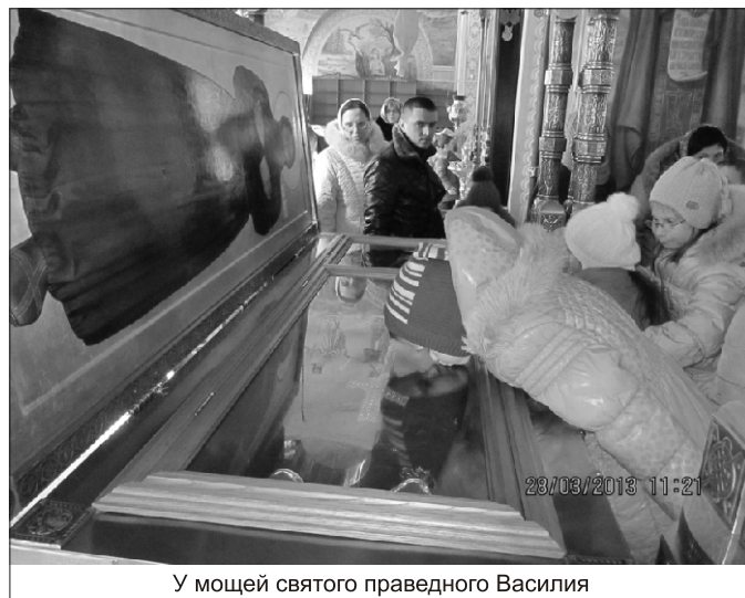
У мощей святого праведного Василия

Подвигаемся чуть вперёд и видим образ святого Никиты Готфского. Этот образ, как нам впоследствии рассказал настоятель, спасли в без-