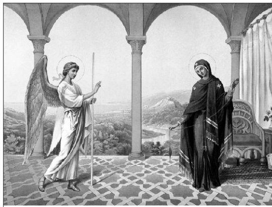
Благовещение Пресвятой Богородицы

В четвертое воскресенье Великого поста совершается память преподобного Иоанна Лествичника, игумена горы Синайския. Преподобный называется Лествичником как автор книги Лествица , в которой он изобразил путь духовного роста, путь приближения к Богу как лестницу с тридцатью ступенями – этапами борьбы с грехами и постижения добродетелей. А игуменом горы Синайския он именуется потому, что был настоятелем монастыря, расположенного на этой го-