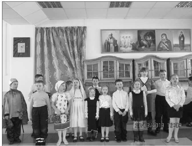
Выступление «Лествицы» в приюте «Никита»

пусе «Никита». Здесь же, в трапезной, устроен зрительный зал. Воспитанники приюта занимают места, и начинается спектакль. Ребята из «Лествицы» подготовили для «Никиты» театрали-