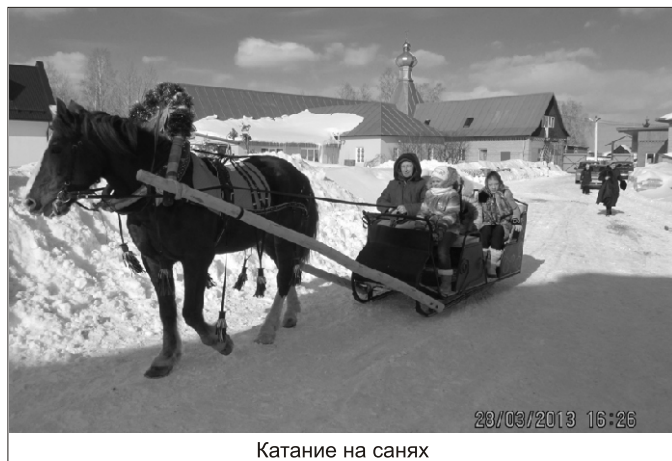
Катание на санях