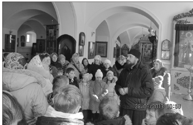
Экскурсия в Покровско-Васильевском монастыре

родка. Наверное, лицо каждого русского города – это храмы и монастыри. Покровско-Васильевский монастырь – главная достопримечательность Павловского Посада. Он вырос из