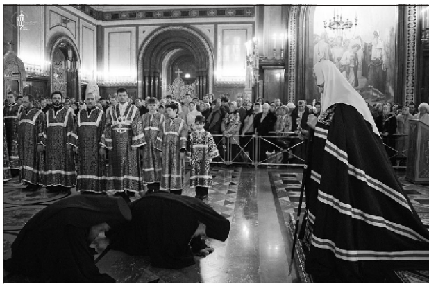
Чин Прощения в Храме Христа Спасителя

Конечно, у человека, живущего в миру и обремененного многочисленными заботами, нет таких условий. Но, тем не менее, человек, подчиняющийся уставам Церкви и старающийся жить по ним, тоже может ощутить всю радость и красоту церковной жизни. Читая утренние и вечерние молитвы, постясь в среду и в пятницу, соблюдая многодневные посты, молясь перед началом и в конце всякого дела, мы можем всю свою