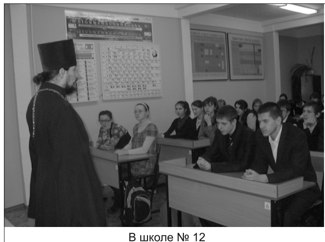
В школе № 12

В преддверии праздника Рождества Христова в Московской епархии традиционно проводятся Московские областные Рождественские образовательные