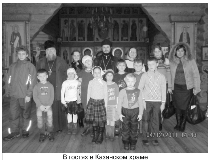
В гостях в Казанском храме

4 декабря, в праздник Введения во храм Пресвятой Богородицы, учащиеся нашей Воскресной школы по-