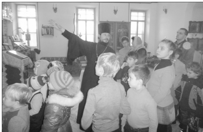
В родном Никольском храме