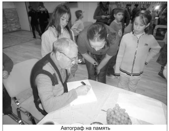
Автограф на память