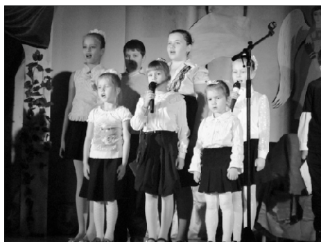
Выступление Воскресной школы «Пчелка»

Учащиеся воскресной школы «Лествица» открыли представление, и взору зрителей предстали маленькие ангелочки с трубами. Потом на сцене мы увидели великолепный танец ангелов, который порадовал и восхитил всех. Ребята рассказывали о смысле праздника и о своих небесных покровителях. Каждый поведал о подвиге того святого, имя которого он носит. Неожиданно для всех