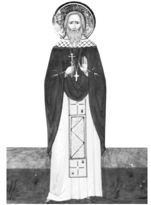
Сщмч. Николай Егорьевский

Вы храм Божий, и Дух Божий живет в вас (1 Кор. 3, 16)