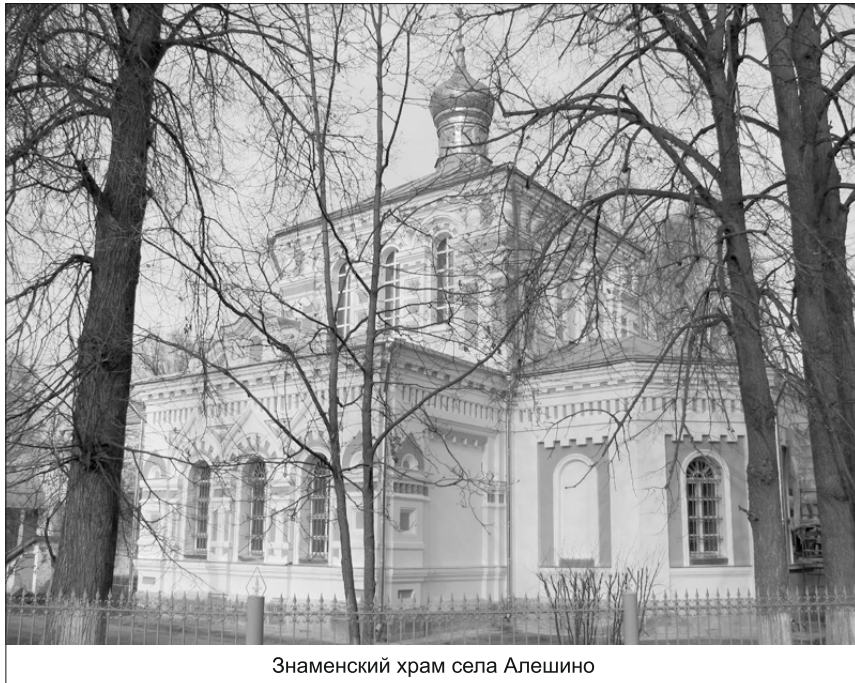
Знаменский храм села Алешино

Учителями ведутся журналы по каждому классу, где отражается уровень успеваемости в познании предмета и ход выполнения учебного плана. Классный журнал не для того, чтобы огорчить менее успевающих детей или развить чувство гордости у других, а чтобы отследить периодичность посещаемости ребенком школы и стимулировать