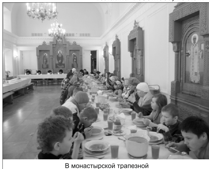
В монастырской трапезной