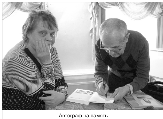
Автограф на память