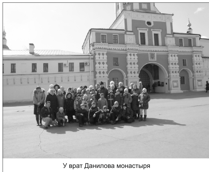
У врат Данилова монастыря

чил на память хорошенькую розочку с ее гроба.