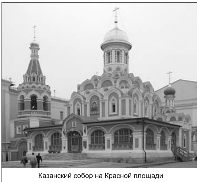
Казанский собор на Красной площади

На 6 ноября в этом году приходится Дмитриевская родительская суббота . В этот же день – память иконы Божией Матери «Всех скорбящих радость». В тех храмах, которые освящены в