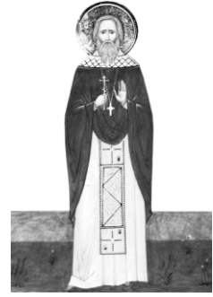
Сщмч. Николай Егорьевский

Вы храм Божий, и Дух Божий живет в вас (1 Кор. 3, 16)