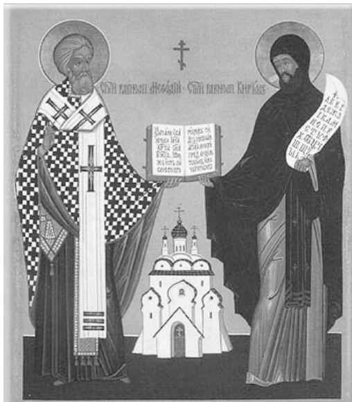
Святые равноапостольные Кирилл и Мефодий