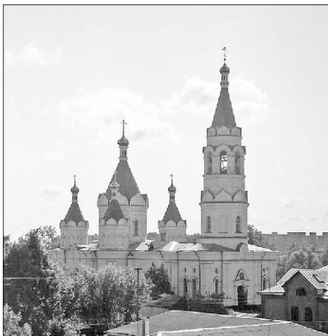
Александро-Невский собор г. Егорьевска