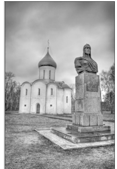
Памятник в родном городе святого Александра Невского