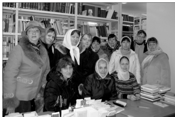
Гости из Егорьевска в монастырской библиотеке

22 октября – Международный день школьного библиотекаря. По сложившейся традиции библиотекари егорьевских школ в этот день совершают паломнические поездки по святым местам Подмоскovie. В этом году они посетили Свято-Никольский Угрешский мужской монастырь. Более 600 лет Святая Угреша является одним из центров русской духовности. «Сия вся угреша сердце мое...» – такую благодать молитвы и помощи Божией испытал святой благоверный князь Димитрий Донской перед битвой на Куликовом поле. Здесь была явлена князю чудотворная икона святителя Николая. На месте этого чуда после победы над татарским войском и был основан монастырь. Обитель прославилась трудами и подвигами многих подвижников русского благочестия. Монастырь был местом богомолья русских государей. По благословению покойного Святейшего Патриарха Алексия II, возрождающийся монастырь стал ставропигиальным, т.е. непосредственно подчиняется Первосвятителю.