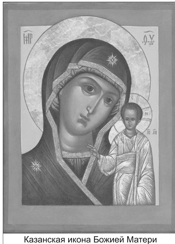
Казанская икона Божией Матери

Примечательны два момента в этом историческом событии: во-первых, реальная помощь и чудесное заступничество Пресвятой Богородицы, во-вторых, то, что предшествовало этому, – активные и решительные действия со стороны народного ополчения. Это значит, что Господь, Пресвятая Богородица готовы нам помочь