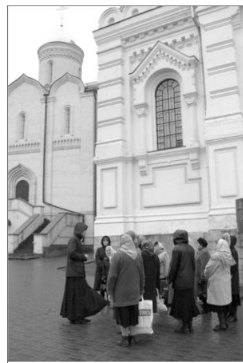
Экскурсия по Николо-Угрешскому монастырю