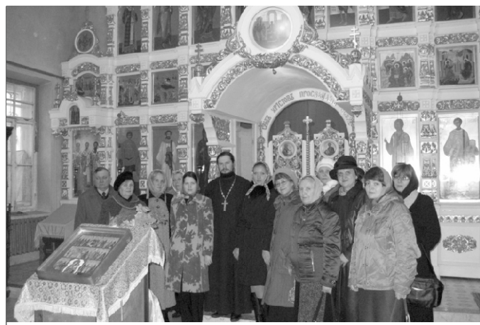
После экскурсии в нашем храме