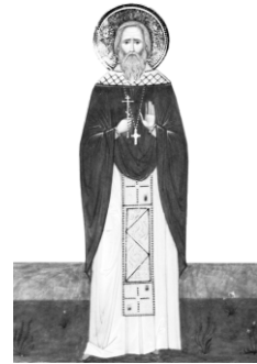
Сщмч. Николай Егорьевский

Вы храм Божий, и Дух Божий живет в вас (1 Кор. 3, 16)