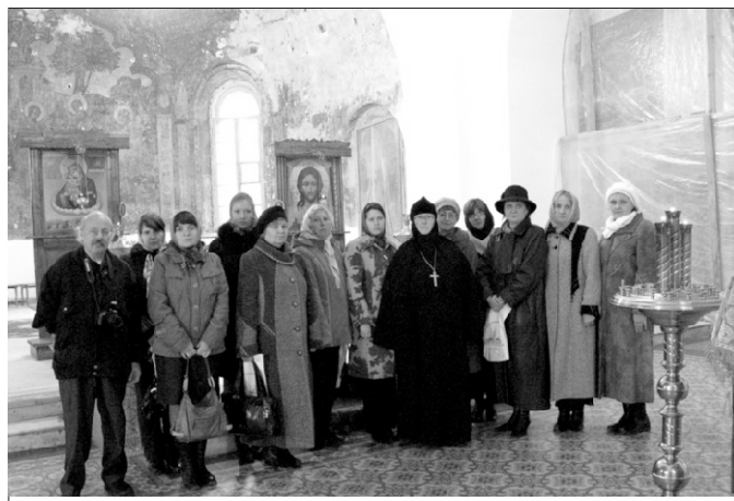
В Троицком монастыре