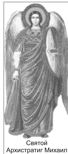
Святой Архистратиг Михаил