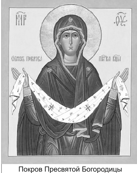
Покров Пресвятой Богородицы

14 октября – Покров Пресвятой Богородицы. Этот Великий праздник установлен в воспоминание видения святым блаженным Христу ради юродивым Андреем и его учеником Епифанием Пресвятой Богородицы. Произошло это в X веке во Влакхернском храме Константинополя во время всеобщего богослужения. Люди собрались на молитву, чтобы испросить у Господа и Пресвятой Богородицы избавление от врагов, грозящих городу разорением (по преданию, это были язычники-славяне). И вдруг во время службы святой блаженный Андрей вместе со своим учеником ясно увидели в храме Пресвятую Богородицу с Иоанном Предтечей, с апостолом Иоанном Богословом и множеством святых. Она молилась Своему Божественному Сыну о помиловании жителей Константинополя и простирала над молящимися Свой Омо-