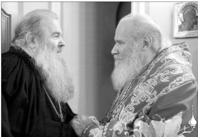
Святейший Патриарх Алексий II и отец Матфей. Теперь они снова вместе.