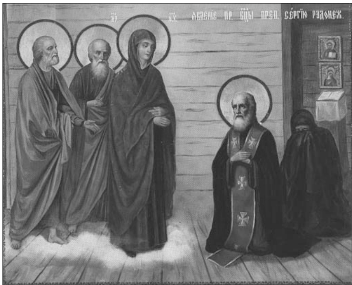
Явление преподобному Сергию Божией Матери

– Петром и Иоанном. Божия Мать сказала, что множество учеников его всегда будет подвизаться на этом месте, и обещала никогда не оставлять обители Своим покровом и заступничеством. И действительно, несмотря на различные испытания, выпавшие на долю монастыря за долгую историю, несмотря на годы гонений, когда Лавра была даже некоторое время закрыта, обитель пре-