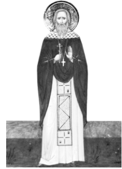
Сщмч. Николай Егорьевский

Вы храм Божий, и Дух Божий живет в вас (1 Кор. 3, 16)