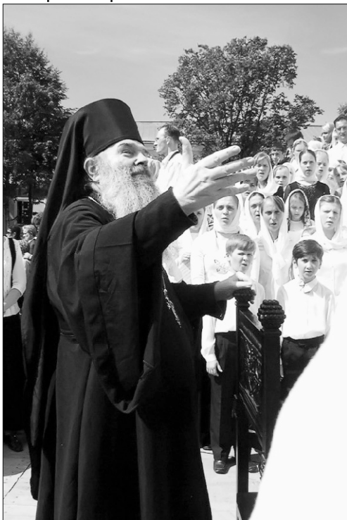
Молебен на Лаврской площади в день памяти преподобного Сергия Радонежского