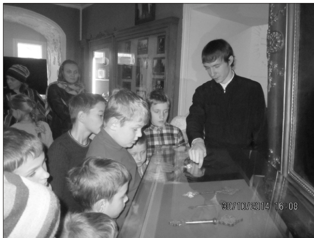
На экскурсии в Церковно-археологическом кабинете Московской духовной академии