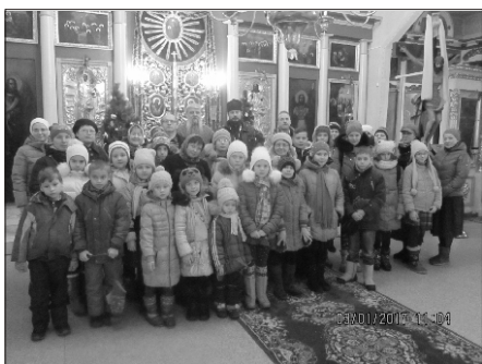
В Троицком храме с. Низкое