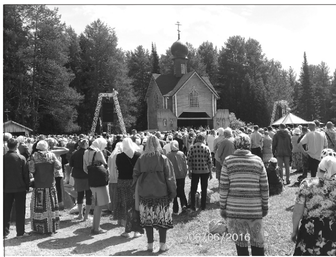
Литургия под открытым небом

Великорецкий крестный ход 2016 года торжественно заканчивается на месте своего исхода – на площади Свято-Успенского Трифонова монастыря благодарственным молебном святителю Николаю и напутственным словом митрополита Вятского и Слободского Марка. Мы прощаемся со всем, что стало для нас за эти удивительные 6 дней дорогим – с чудотворной Ве-