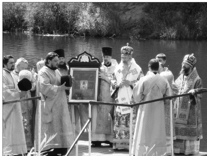
В день обретения святыне на реке Великой