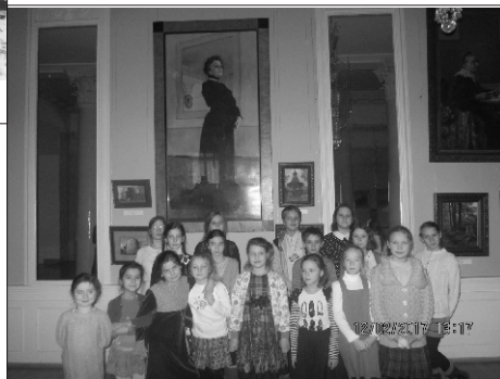
В Малом театре