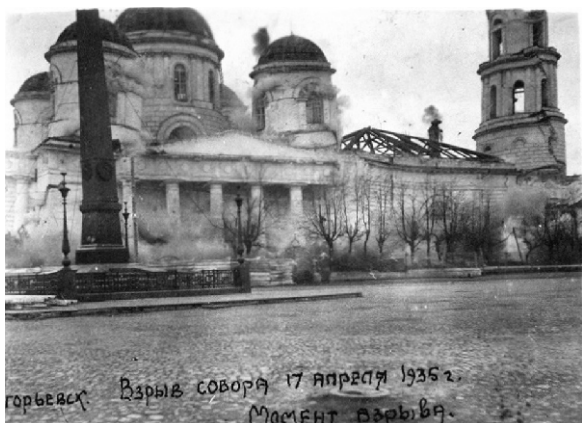
Егорьевск. Взрыв собора 17 апреля 1935 г. Момент взрыва.