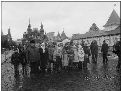
У исторического музея

монастыре. Помолились у мощей святителя Тихона, ознакомились с уникальной экспозицией его кельи, которая на несколько лет стала местом заточения Святейшего Патриарха. Мы увидели фотографии начала 20-х годов, портреты и зарисовки Павла Корина, сделанные во время похорон Святителя, облачение фабрики Оловянишниковых, в котором служил Патриарх, его личные вещи и книги. Послушник монастыря рассказал нам о секретах монастырской мироварни, показал чудом уцелевшие барельефы храма Христа Спасителя, взорванного большевиками в 1935 году.