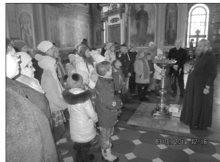
Пятницкий храм с. Туголес