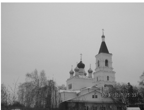
Преображенский храм с. Андреевские выселки