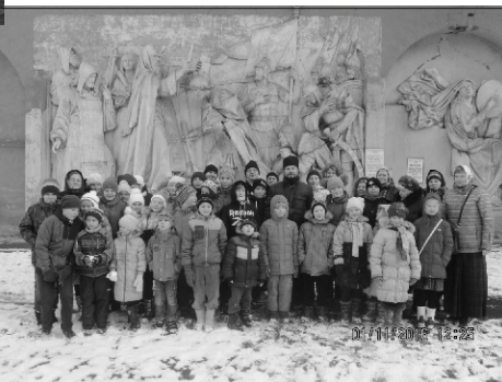
В Донском монастыре

Накануне Великого Поста младшие школьники побывали в Малом театре на Большой Ордынке и посмотрели чудесный спектакль «Золушка». Изумительная игра талантливых актеров, а также свето-